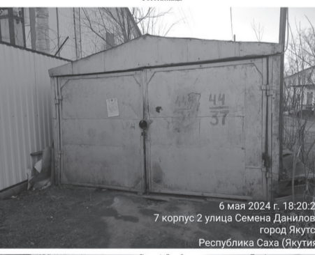
6 мая 2024 г. 18:20:28 7 корпус 2 улица Семена Данилова город Якутск Республика Саха (Якутия)