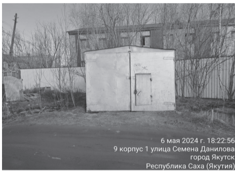
6 мая 2024 г. 18:22:56 9 корпус 1 улица Семена Данилова город Якутск Республика Саха (Якутия)