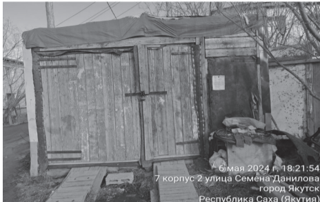
6 мая 2024 г. 18:21:54 7 корпус 2 улица Семена Данилова город Якутск Республика Саха (Якутия)