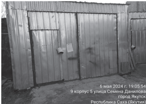
6 мая 2024 г. 19:05:54 9 корпус 5 улица Семена Данилова город Якутск Республика Саха (Якутия)