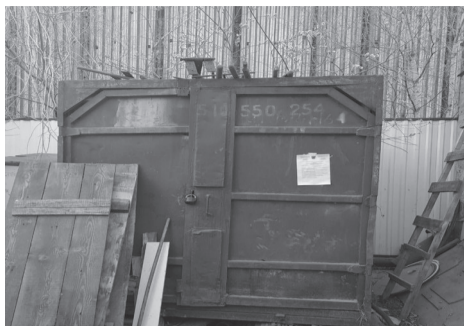
6 мая 2024 г. 19:07:48 9 корпус 5 улица Семена Данилова город Якутск Республика Саха (Якутия)