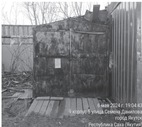
6 мая 2024 г. 19:04:43 9 корпус 5 улица Семена Данилова город Якутск Республика Саха (Якутия)