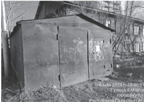
6 мая 2024 г. 18:46:51 2 улица 8 Марта город Якутск Республика Саха (Якутия)