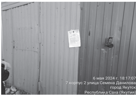
6 мая 2024 г. 18:17:07 7 корпус 2 улица Семена Данилова город Якутск Республика Саха (Якутия)