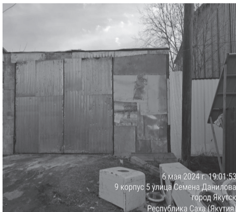
6 мая 2024 г. 19:01:53 9 корпус 5 улица Семена Данилова город Якутск Республика Саха (Якутия)