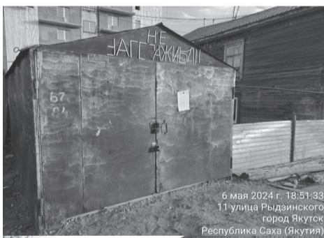
6 мая 2024 г. 18:51:33 11 улица Рыдзинского город Якутск Республика Саха (Якутия)