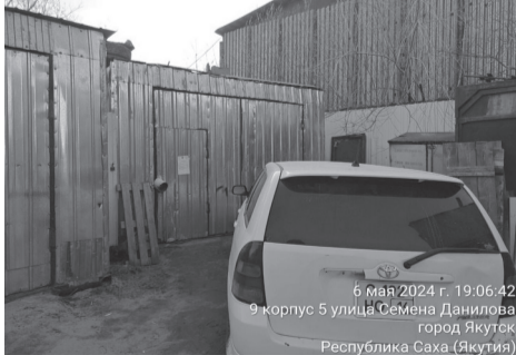
6 мая 2024 г. 19:06:42 9 корпус 5 улица Семена Данилова город Якутск Республика Саха (Якутия)