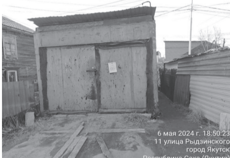
6 мая 2024 г. 18:50:23 11 улица Рыдзинского город Якутск Республика Саха (Якутия)