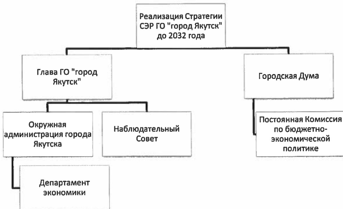
Рис. 5.1. Организационная структура управления стратегией

Рекомендуемая организационная структура управления реализацией стратегии представлена рис. 5.1.