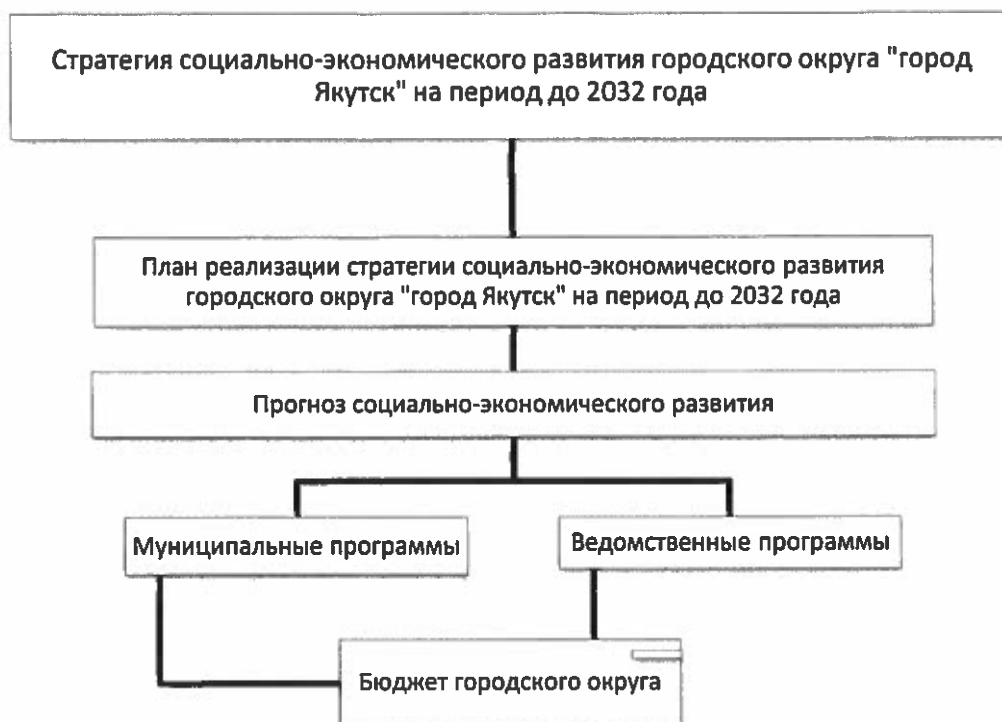
Рис.5.2. Состав основных элементов механизма реализации Стратегии

Основным инструментом механизма реализации Стратегии является совокупность муниципальных и ведомственных программ, на основе которой формируется бюджет городского округа «город Якутск» с соблюдением принципов программно-целевого управления социально-экономическим развитием.